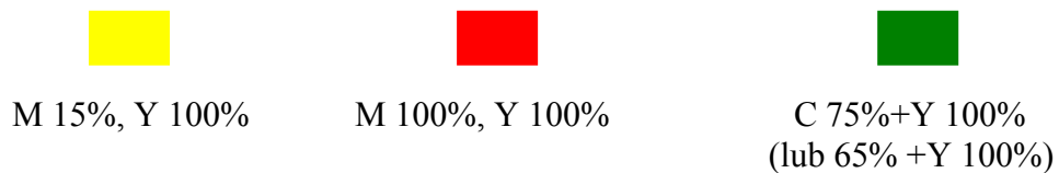
Tabela przełożenia kolorów- CMYK

Prostokątny płat składający się z dwóch poziomych pasów żółtego i czerwonego, jednakowej szerokości, z umieszczonym centralnie herbem powiatu. Proporcje flagi 5:8.